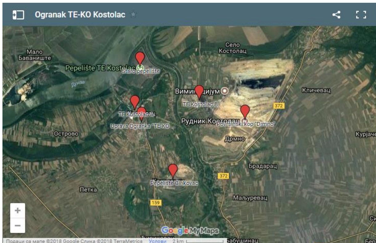
Мапа 2 - локација производних и осталих постројења Огранка ТЕ-КО Костолац (сателитски приказ)

У оквиру производне целине за производњу енергије налазе се и две депоније за одлагање пепела и шљаке који се јављају као пратећи производи сагоревања угља у термоблоковима. Депонија на Средњем костолачком острву (СКО) се налази у близини села Стари Костолац; њено фазно затварање и рекултивација се планирају у периоду од 2019. до 2021. године, а до тада треба да послужи као резервна варијанта за депоновање пепела и шљаке из обе термоелектране. Депонија на ПК "Ђириковац" је пуштена у рад 2010. године и налази се у близини села Кленовник. На њој је примењена технологија одлагања пепела и шљаке "густом хидромешавином".