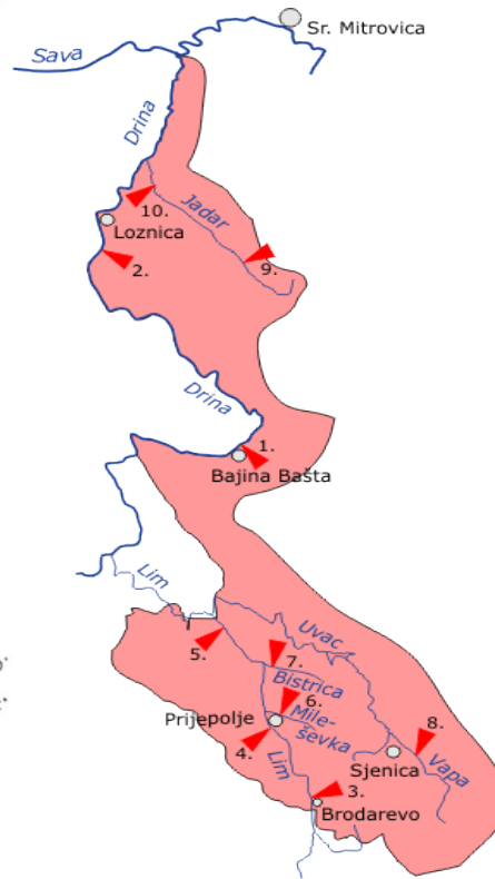
Слика.бр. 2. Сливно подручје реке Дрине

У саставу Огранка ХЕ „Бајина Башта“, у оквиру производних капацитета су садржани: