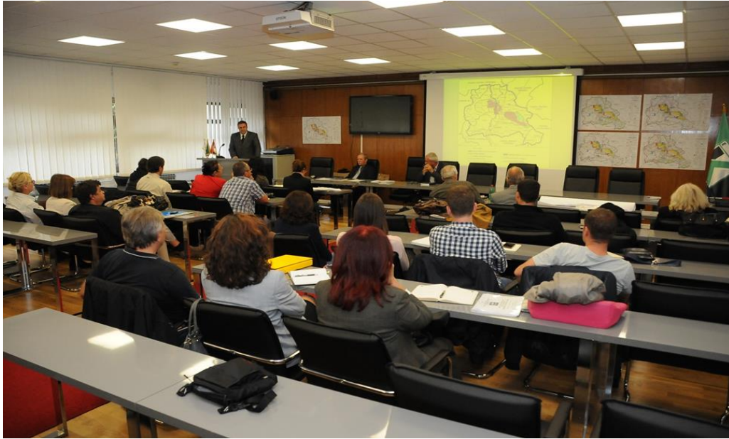
Слика 2: Зграда пословодства Огранка РБ „Колубара“: Јавна седница Комисије за јавни увид у Нацрт просторног плана подручја експлоатације колубарског лигнитског басена