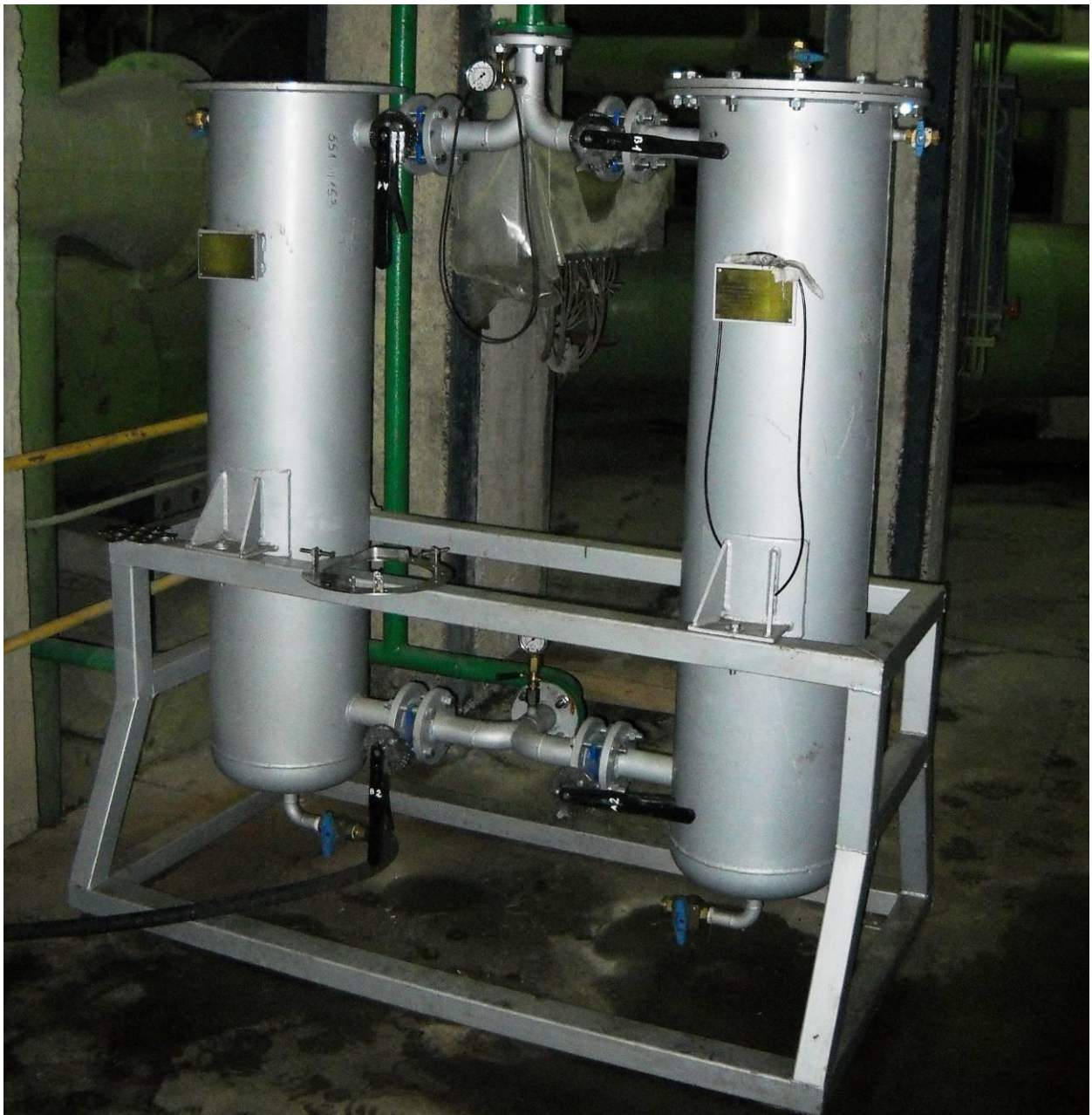
Slika 4. Filterska jedinica

Protok kondenzata, ostvaren je na osnovu razlike u geodezijskim visinama između hladnjaka otparaka i izlazne cevi filterskog uređaja.