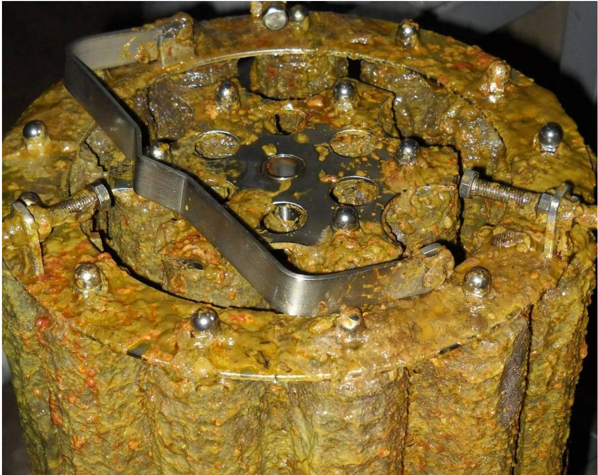
Slika 5. Ulošci filterske jedinice zaprljani emulzijom ulja i kondenzata zaptivne pare

zaprljanja filtera ili su oba filtera pregradjena iz nekog razloga, nivo vode u dovodnoj cevi će rasti do nivoa cevi 9 kada će kondenzat zaobići filtersko postrojenje preko cevi 9 i preko ventila 5, sifona 6 i cevi 7, biti evakuisan u kondenzator. Na ovaj način obezbedjena je sigurnosna funkcija da se ne bi ugrozio rad bloka. Visinom ugrađenog cevovoda 9, a imajući u vidu geodezijske visine hladnjaka otparaka i filtera, definisan je maksimalni mogući pad pritiska kondenzata pri prolasku kroz filtere. Cevovod 9 povezan je sa cevovodom 10, koji je povezan sa atmosferom na višoj koti od cevovoda 9. Cevovod 10 služi kao odzraka, odnosno da prekine jednom uspostavljeno strujanje kroz cevovod 9 usled sifonskog dejstva, kada se ponovo uspostave uslovi za strujanje kroz filtere. Ventili 11 i 12 koriste se za uzimanje uzoraka kondenzata pre i posle filtera radi kontrole i analize.