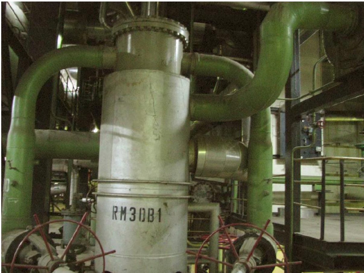
Slika 2. Hladnjak otparaka zaptivne pare

potpunog zaptivanja, uljne pare i kapi ulja iz ležajeva, slivaju se na vratilo, bivaju usisane zajedno sa vazduhom i otparcima zaptivne pare i zatim se mešaju sa kondenzatom zaptivne pare.